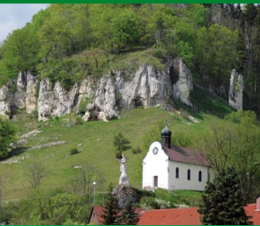
Hütten im Schmiechtal