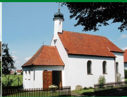
Annakapelle in Dietenheim