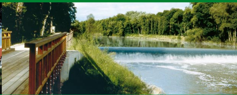
Staustufen an der Iller