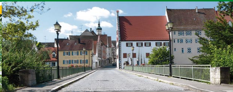
Munderkingen an der Donau