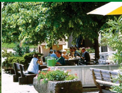
Einkehr in Mochental, Schlosshof