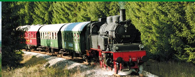
Dampfzug auf der Lokalbahn