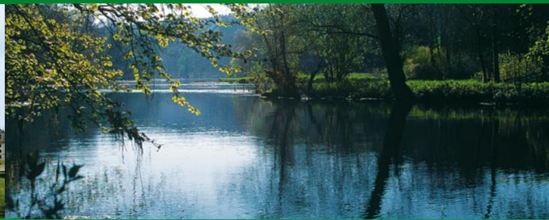
Braunselmündung in die Donau