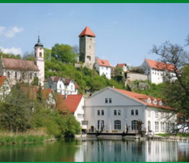
Rechtenstein a. d. Donau